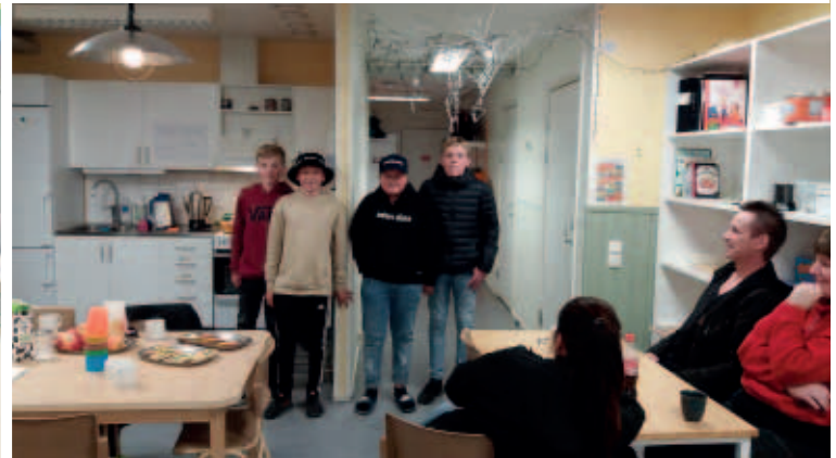
Under Torsbymårten var Forsbackens förskola öppen dit föräldrar och ungdomar kunde komma för en fika, lite värme eller en pratstund.