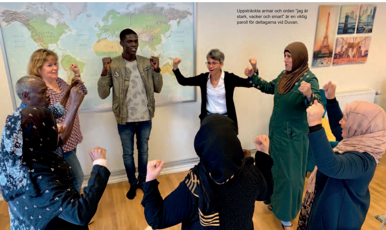
Uppsträckta armar och orden "jag är stark, vacker och smart" är en viktig paroll för deltagarna vid Duvan.