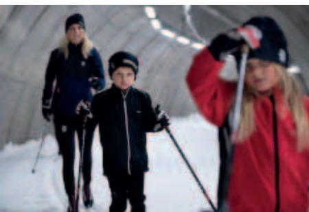
I skidtunneln är alla välkomna, stora som små