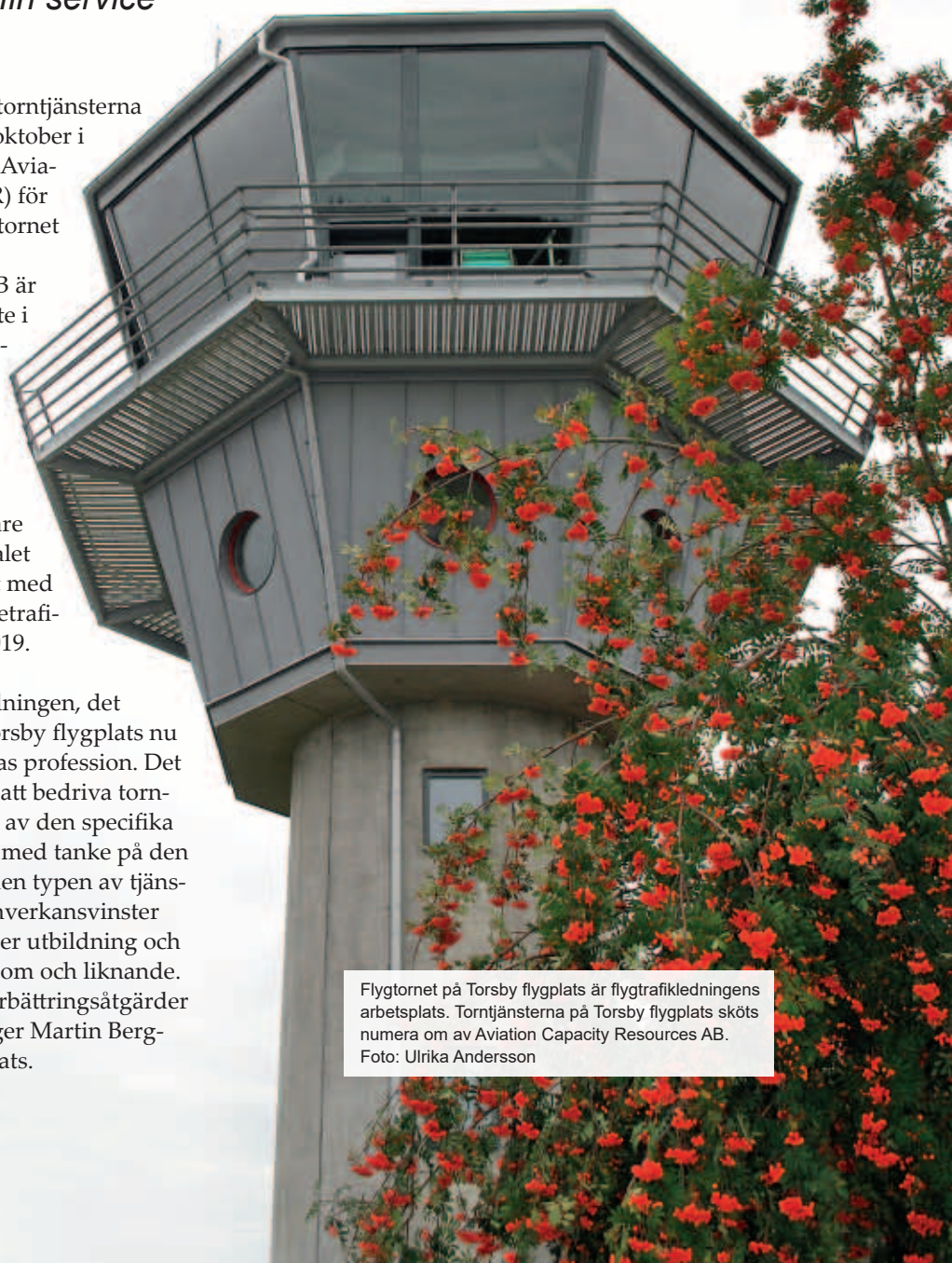
Flygtornet på Torsby flygplats är flygtrafikledningens arbetsplats. Torn tjänsterna på Torsby flygplats sköts numera om av Aviation Capacity Resources AB.