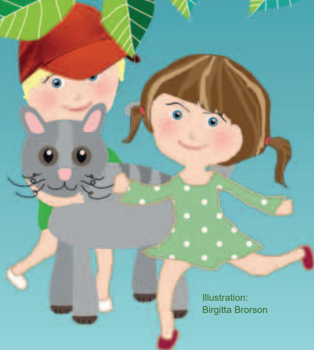
Illustration: Birgitta Brorson