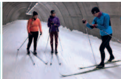
Ta hjälp av instruktör och träna tillsammans