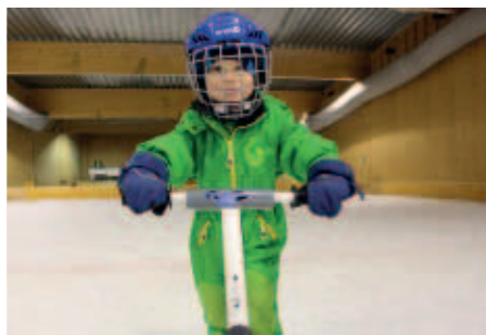
Skridskobanan är väldigt populär